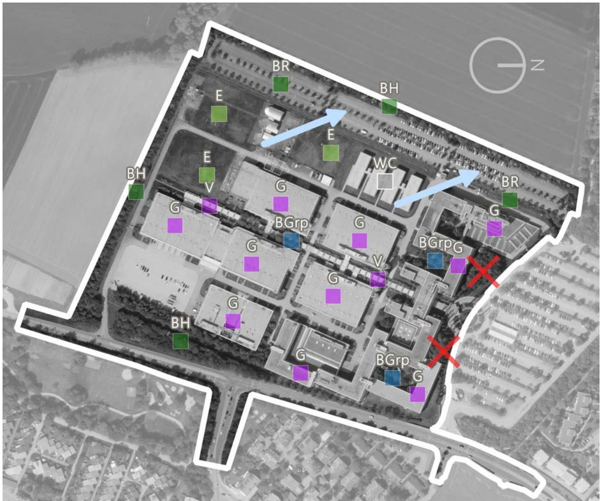
Abbildung 2: Im Geltungsbereich vorkommende Lebensräume

nordwestlichen Teil zwischen den Wohncontainern (WC) und der Westgrenze gelegenen, nicht mehr genutzten Parkplätzen weisen Saumstrukturen und Habitatrequisiten auf, die ein Vorkommen der Zauneidechse nicht ausschließen lassen.