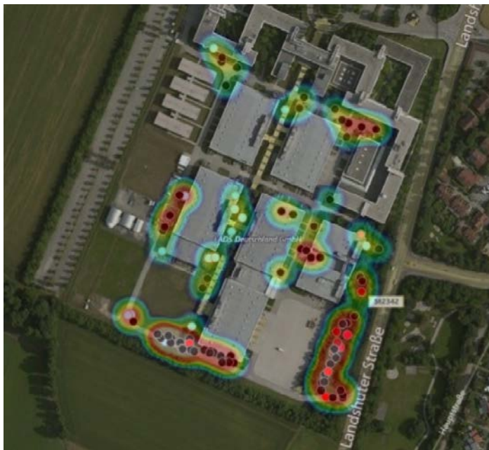
Abbildung 4: Verteilung der Fledermausaktivität im B-Plan-Gebiet

Die Attraktivität des Untersuchungsgebiets als Jagdhabitat war insgesamt gering. Die Aktivität stieg im Jahresverlauf mit einem Peak im Spätsommer, der evtl. als bereits zugbedingt einzuschätzen ist, an. Intensive, ganzjährig genutzte Bereiche (vgl. Abb. 3) befanden sich insbesondere entlang der östlichen und südlichen Gehölzlinien. Hier ist davon auszugehen, dass diese Bereiche zur Jagd aufgesucht werden und damit als Nahrungshabitat dienen.